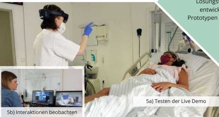
5a) Testen der Live Demo

Auf Augenhöhe Lösungsszenarien entwickeln und Prototypen mitgestalten