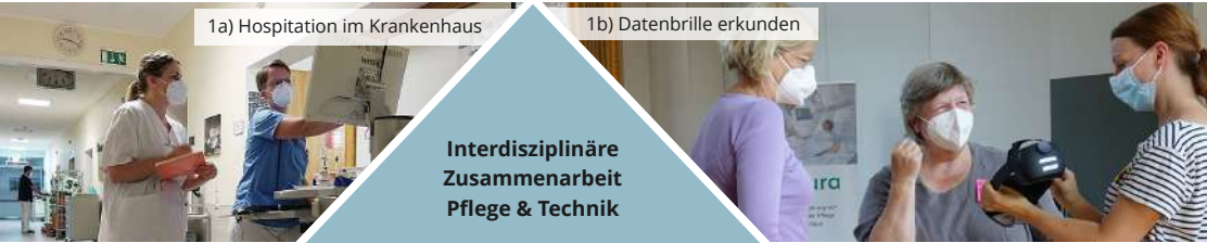
1b) Datenbrille erkunden

Interdisziplinäre Zusammenarbeit Pflege & Technik