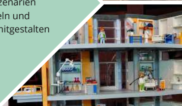
4) Erste Papier-Prototypen